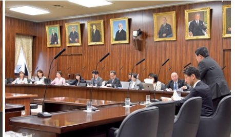
質問に対し答弁する関係閣僚